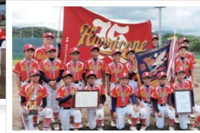
6年生チーム 第35回OHK杯香川県学童軟式野球選抜大会 県大会 優勝