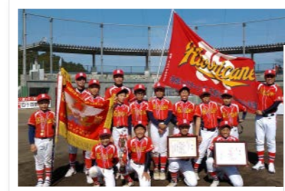
新5年生チーム 第13回百十四銀行旗香川県学童軟式野球新人大会 県大会 優勝